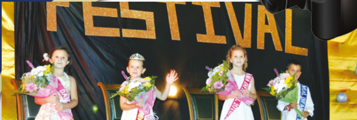
Momento del nombramiento de la Reina, Damas y Zagal durante las últimas fiestas patronales