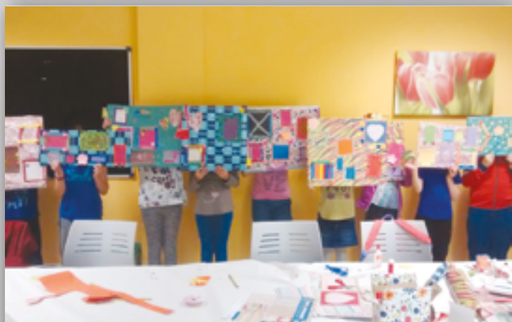
El taller de scrapbook celebrado al inicio del verano