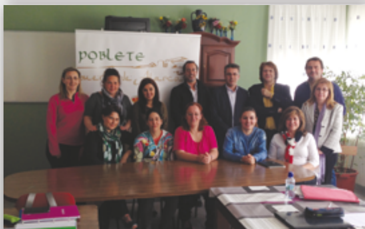
Participantes en el taller de empleo municipal