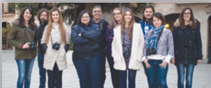
Participantes en el curso de fotografía de la biblioteca municipal