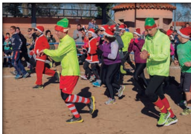
Carrera del Pavo