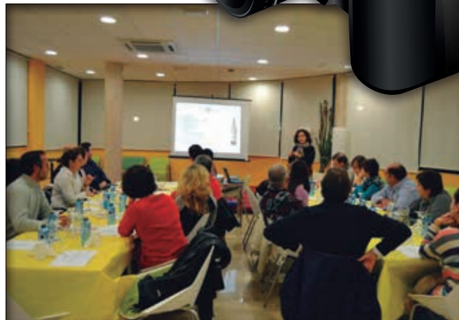
Curso de Cata de Vinos