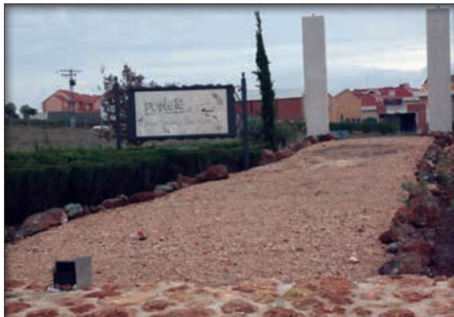
La rotonda que da acceso a Poblete por la entrada Norte