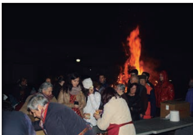
Hoguera de Santa Lucía