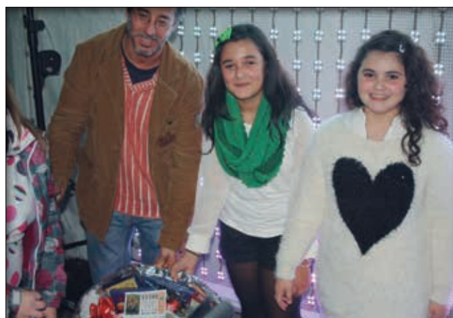
Ganadoras del concurso de Villancicos