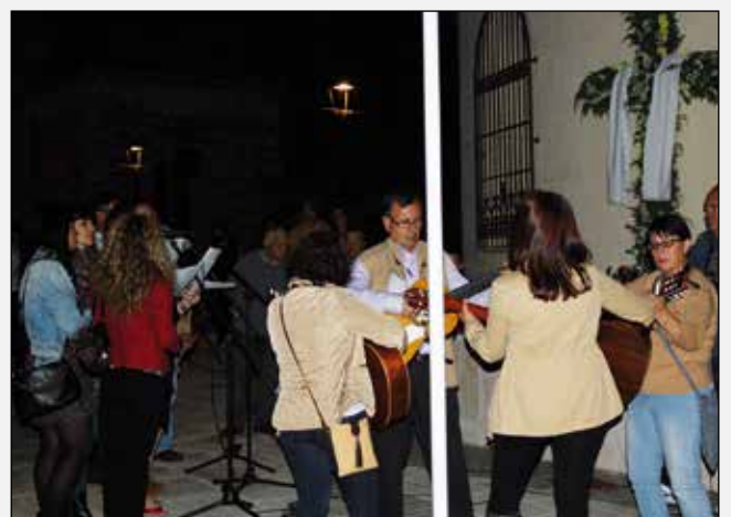
Bienvenida al mes cantando los Mayos