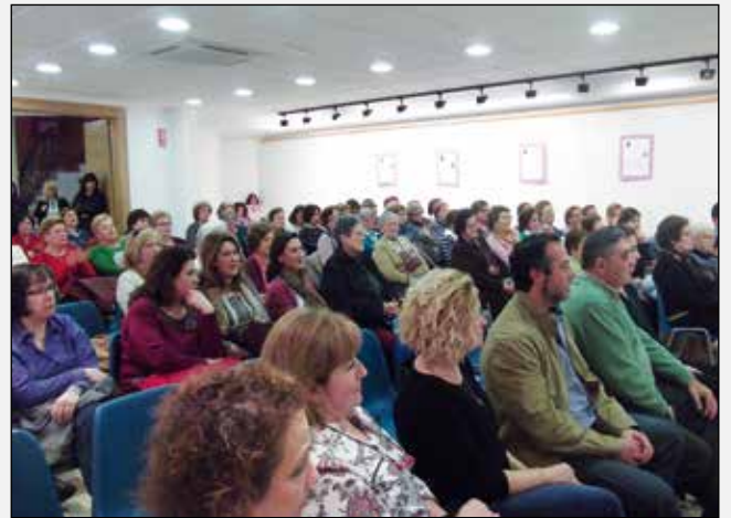
Acto institucional del Día de la Mujer