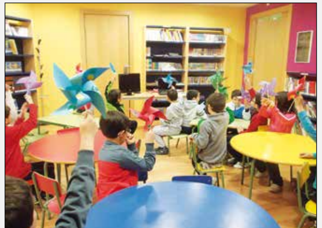
Mañana de cuento en la Biblioteca