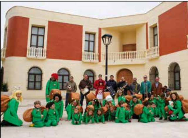
Una plaga de caracoles recorrió Poblete en Carnaval