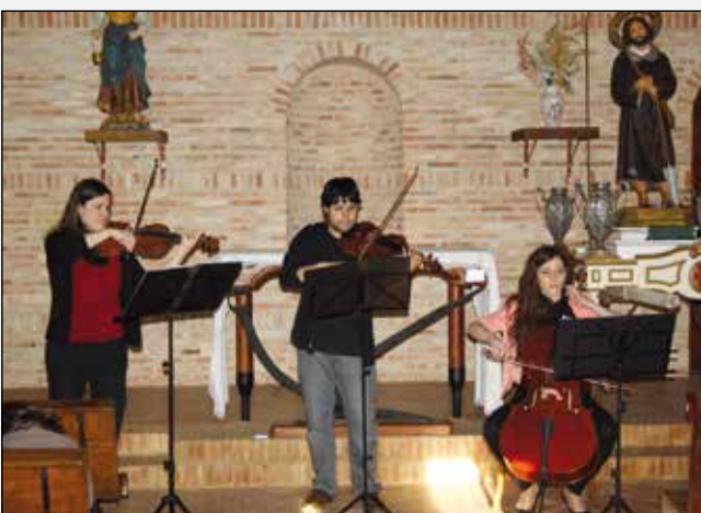
Concierto Musicordae en San Isidro