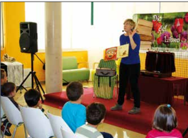
Cuentacuentos para celebrar el Día del Libro